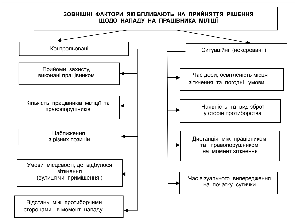
Рис. 2. Сукупність зовнішніх факторів, які чинять вплив на поведінку правопорушника під час зіткнення із працівником міліції