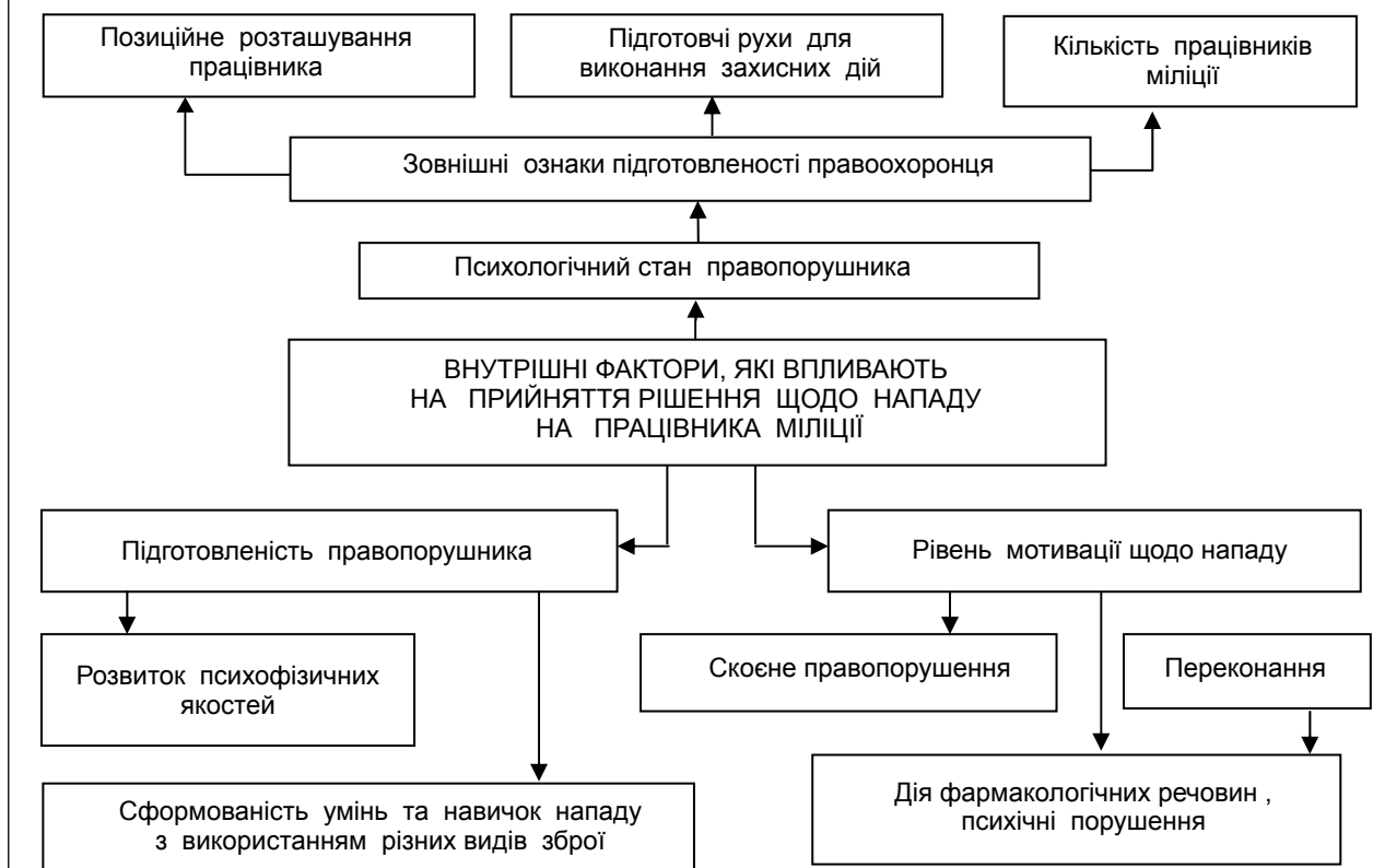
Рис. 3. Сукупність внутрішніх факторів, які чинять вплив на поведінку правопорушника під час зіткнення із працівником міліції